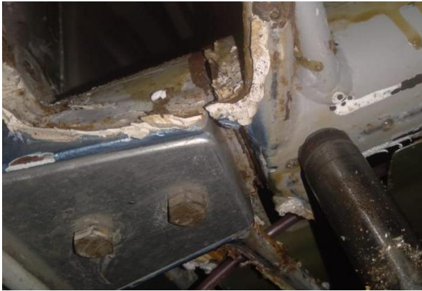
Figura 1 – Trincas no tubo de aço 4130 localizado no trem de pouso principal Figure 1 – Cracks in the steel tube 4130 situated in the main landing gear

1 where what happened is shown. On aircraft from S/N 001 to 010 this incident may occur due to the absence of structural reinforcement at the specified point.