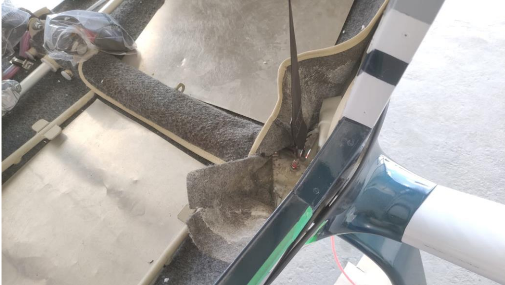
Figura 2 – Retirar o carpete que reveste o tubo central Figure 2 - Remove the carpet covering the central tube